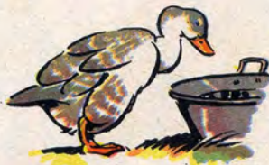
u ne oie