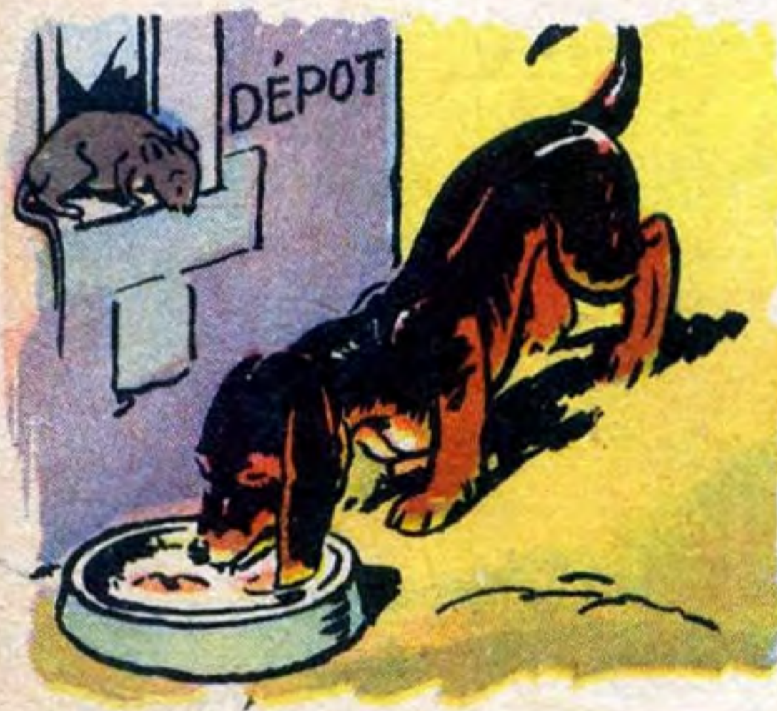
to bi dî ne un rat rô de

da dé do du de di la du no u ne da me. u ne du ne. a dè le. un dé u ne pé da le. la pom ma de. u ne ru a de.