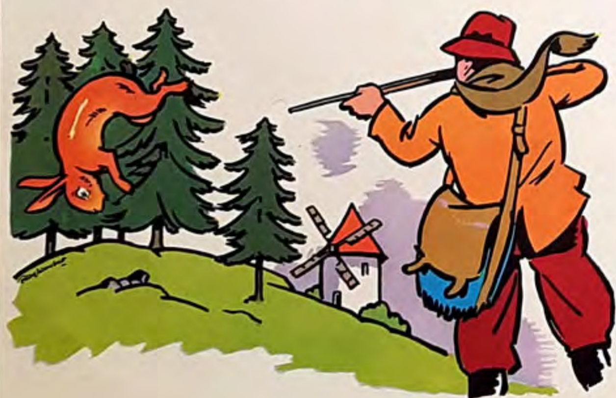
an to nin a tu é ja not la pin

cha sse là - bas - tout à coup, pan ! pan ! an to nin a tiré - ja not dé ri bou le dans le ra vin du mou lin - ja not est tu é -