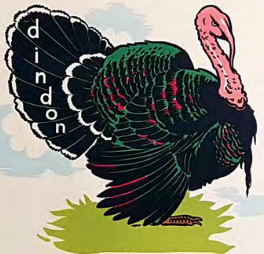
un din don

les la pins dan sent la ron de dans le bois de sa pins - ja not s'é cha ppe - où vas - tu ? de man de le din don - le pin son dit : mé fie - toi, an to nin