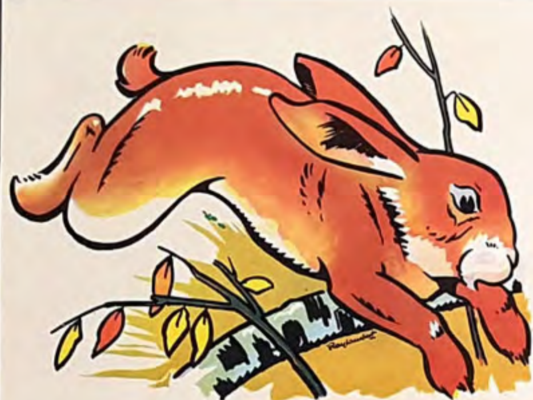
ja not la pin