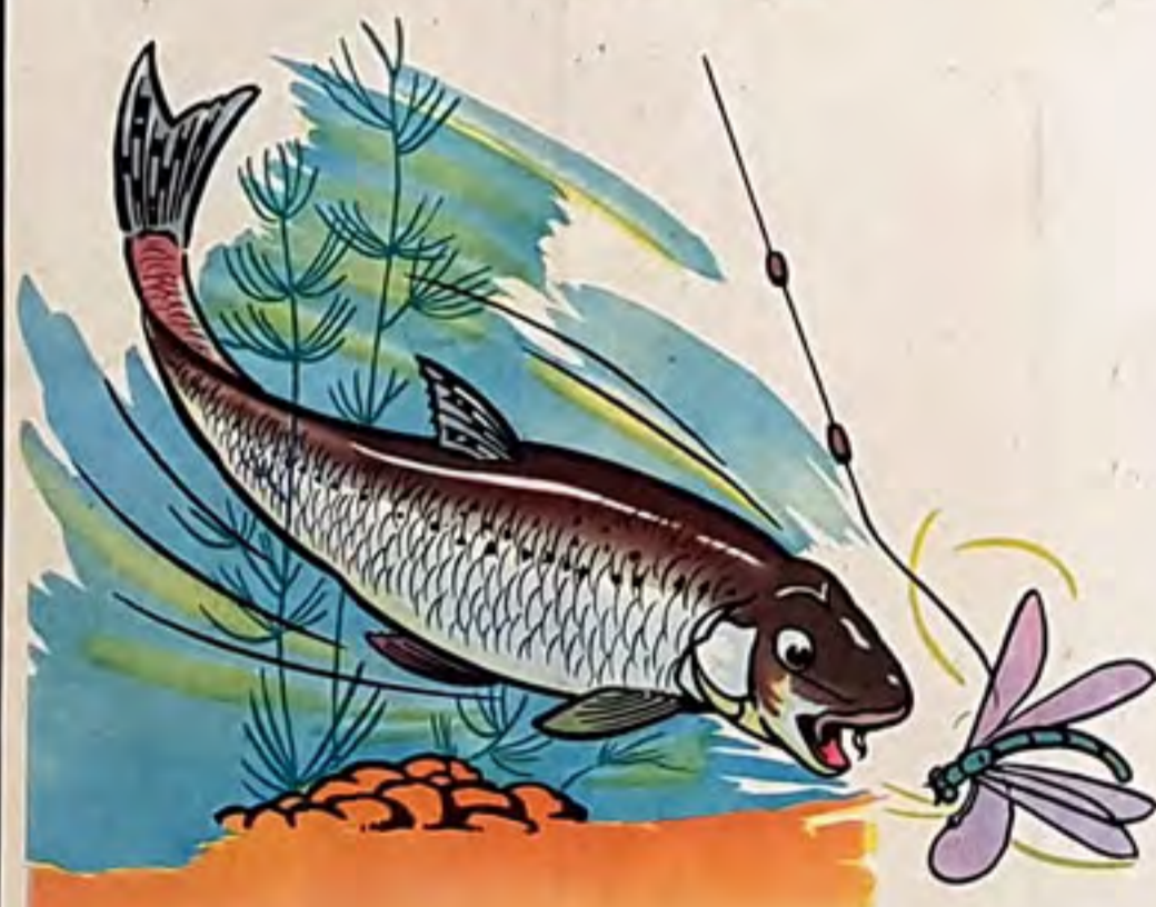
un goujon happe un mouche ron

à la pêche : tout le monde dans le canot! - la rivière coule le long des buissons touffus - d'un coup d' é aviron père chasse une file de canetons - rémi tombe dans la boue - a line rit - petit polisson dit papa tu mérites le bâton - à la pêche nous rions