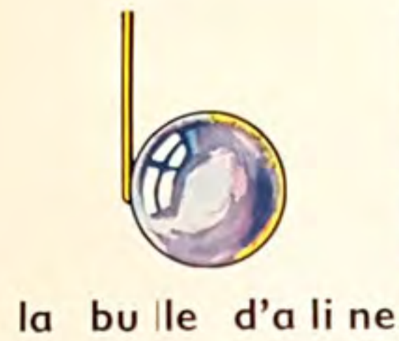
la bu lle d'a li ne