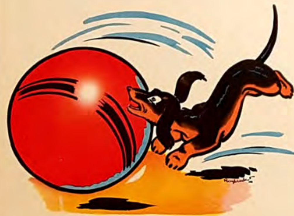
to bi dé ro be la ba lle

a li ne do nne à bo bet te la ba lle et les cu bes - a vec un tu be a li ne ti re des bu lles d'u ne ba ssi ne - to bi dé ro be la ba lle à bo bet te - ré mi pu nit to bi et du sa bot li bè re la ba lle - to bi se ra ba ttu