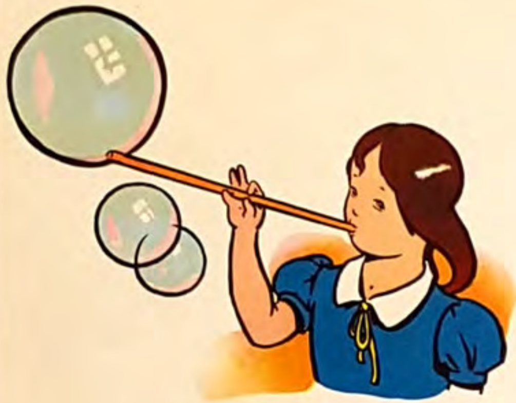
la bu lle d'a li ne