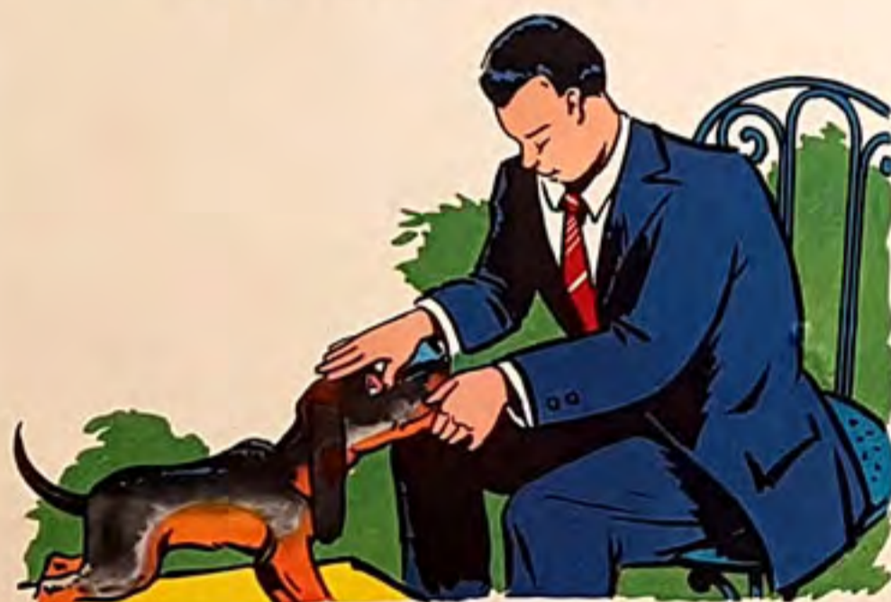
pa pa ta po te la t ê te de to bi