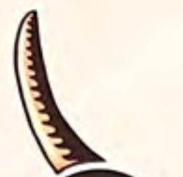
é pé e